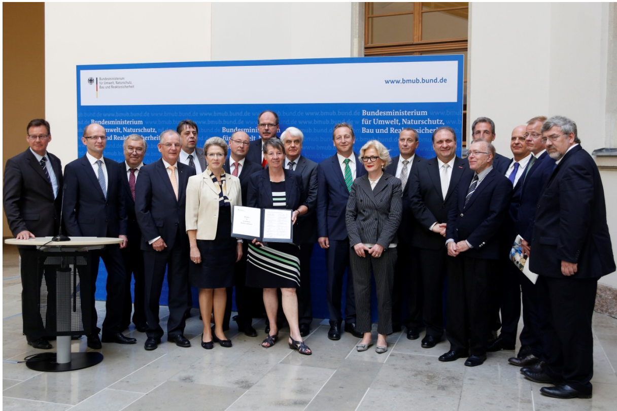
Abbildung 1: Bundesbauministerin Dr. Barbara Hendricks mit den Repräsentanten des Bündnisses für bezahlbares Wohnen und Bauen nach Unterzeichnung der gemeinsamen Erklärung im Rahmen der Auftaktveranstaltung am 10. Juli 2014.

Länder finanziell bis Ende 2019 über die so genannten Kompensationsmittel und verstärkt sein Engagement in den kommenden Jahren: 2016 bis 2019 steigen die jährlichen Kompensationsmittel um jeweils 500 Millionen Euro auf dann insgesamt 4 Milliarden Euro.