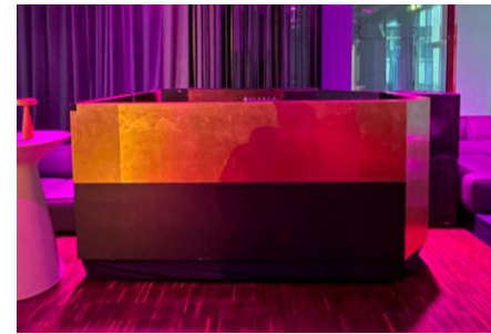
DJ PULT 4.499 *