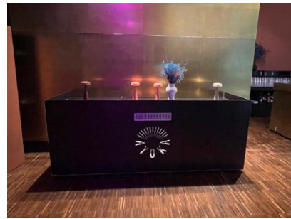
FRONT DESK 4.499 *