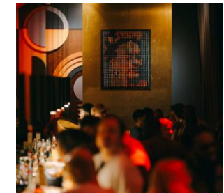
PARTNER TICKET 999 **