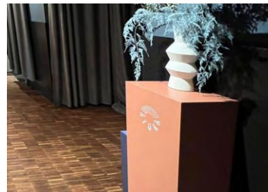
DEKOSÄULE 2.999 *