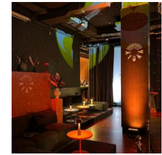
SÄULE 3.499 *