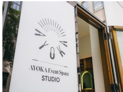
PLATIN auf Anfrage