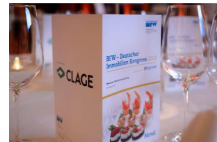
LOGOARTNER 1.999 *